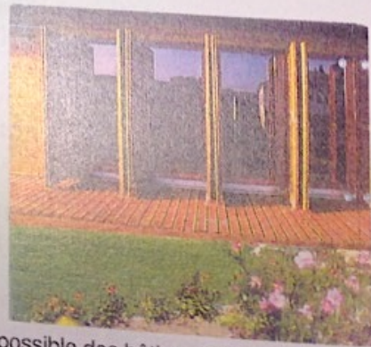
Images de référence : un traitement possible des bâtis avec un matériau dominant en bois, une ouverture claire sur les jardins